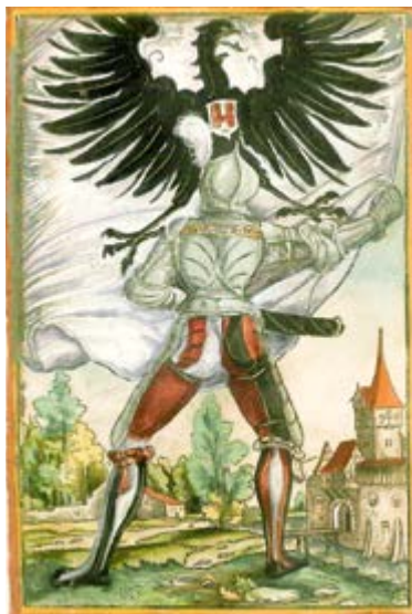
Image of Rothenburg from a armorial book from 1545

their independence during Napoleon's revision of Europe's borders. By 1806, Bonaparte put an end to the Empire in its entirety. Deprived of imperial privilege, Rothenburg succumbed to history and was peacefully absorbed by the Electoral Principality of Bavaria – Baiern, or Bayern, where it remains to this day in the heart of the Middle Franconian region of the Bavarian "Freistaat". However, a large part of Rothenburg's extensive territory or "Landwehr" wound up being turned over to nearby Württemberg as Napoleon arbitrarily adjusted boundaries at will.