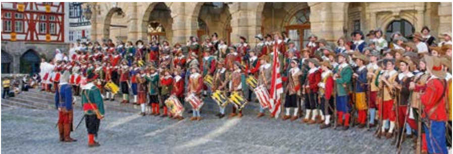
Das Historische Festspiel »Der Meistertrunk« am Marktplatz in Rothenburg

VERANSTALTER: Historisches Festspiel »Der Meistertrunk« e.V., www.meistertrunk.de