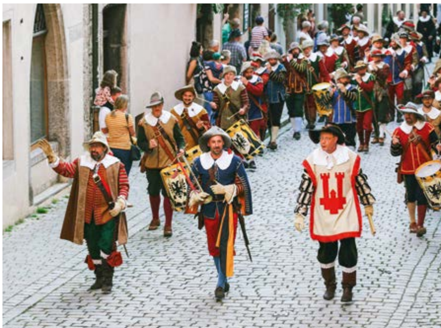
Great historical parade on Pentecost