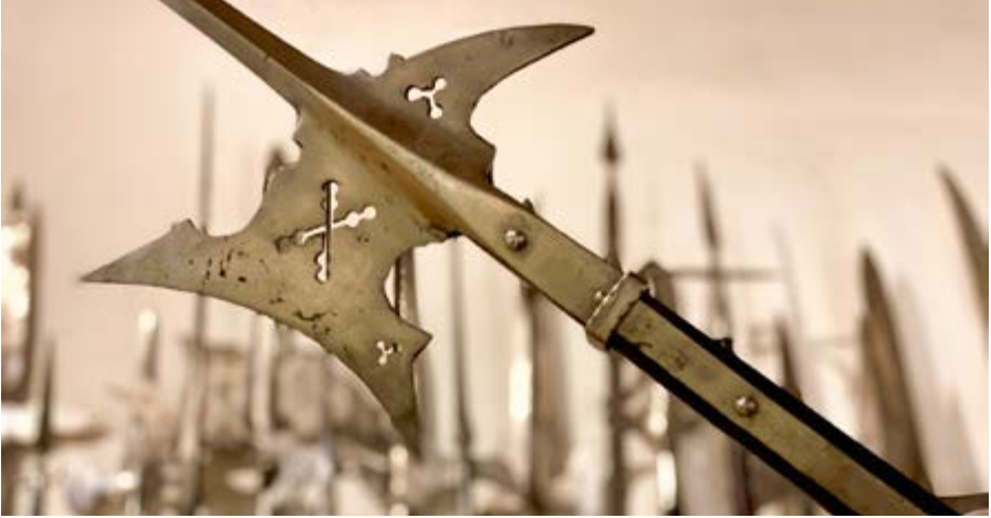
Die Hellebarde – eine typische Waffe der reichsstädtischen Zeit