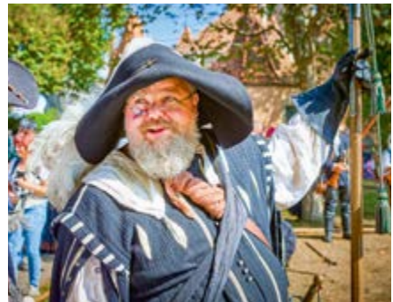
Imperial City Festival in Rothenburg

medieval, traditional, highly colorful garb, these costumed flag throwers will convey the greetings of that once mighty city state republic to equally ancient Rothenburg, it will be a spectacle right out of the Middle Ages. At 6 p. m. the fanfares of the fife and drum corps will announce the historical festival play "Der Meistertrunk" which plays such an important part in Rothenburg's history. Since its first performance in 1881, the play has been performed annually recalling the legendary saving of the city in 1631 in the middle of the tumultuous Thirty Years War. Lord Mayor Dr Markus Naser will give welcoming remarks with the opening music to the theatrical performance written by Karl Wüst. This infrequently played overture will be performed by the Städtische Jugendblasorchester, the Municipal Youth Wind Orchestra under the direction of Jan-Peter Scheuer. At 6.30 p.m. scene from the Meistertrunk play will be shown in stage director Reiyk Bergemann's production. This half-hour overview will conclude with a festive finale at 9 p. m. LOCATION: Market Square Rothenburg ob der Tauber ORGANIZATION BY: Stadt Rothenburg ob der Tauber, Dienststelle V "Tourismus, Kunst und Kultur", www.rothenburg.de