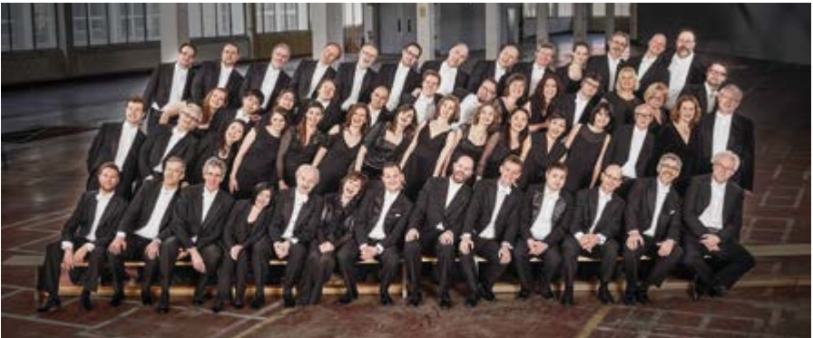
Die Nürnberger Symphoniker

ORT: Reichsstadthalle, Spitalhof 8, 91541 Rothenburg ob der Tauber VERANSTALTER: Stadt Rothenburg ob der Tauber, Dienststelle V »Tourismus, Kunst und Kultur« www.rothenburg.de , www.reservix.de